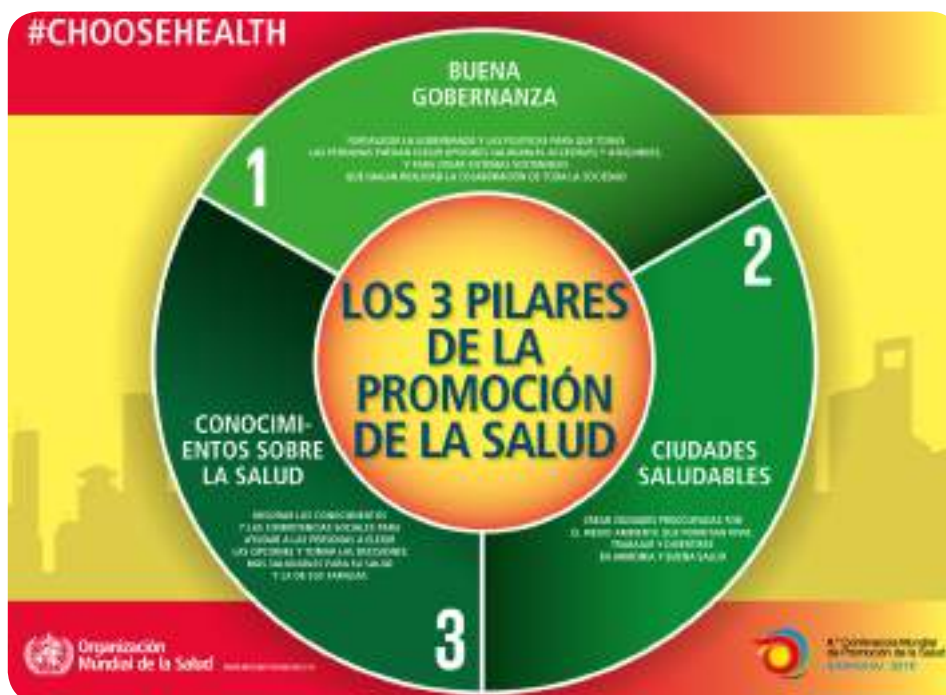
Infografía: Declaración de Shangai, 2016

Las ciudades tienen un papel principal en la promoción de la buena salud. El liderazgo y el compromiso en el ámbito municipal son esenciales para una planificación urbana saludable y para poner en práctica medidas preventivas en las comunidades y en los centros de atención primaria. Las ciudades saludables contribuyen a crear países saludables y, en última instancia, un mundo más saludable.